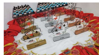
Troféus do FARAES