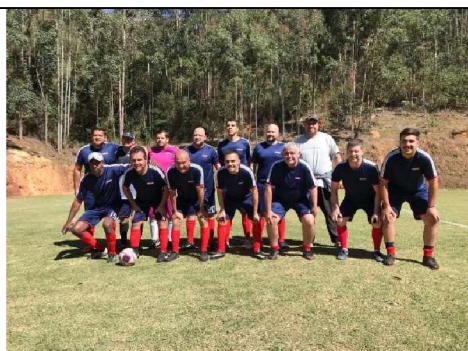
1º COLOCADO: CFP 7.91 - Botucatu