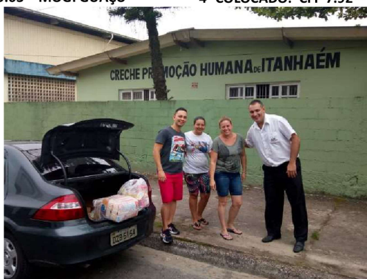
ENTREGA PARA CRECHE PROMOÇÃO HUMANA EM ITANHAÉM