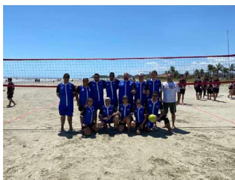
2º COLOCADO: CFP 6.02 – RIBEIRÃO PRETO