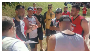
Festival de Voleibol Misto