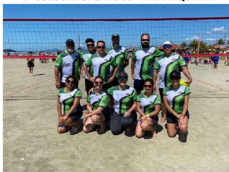
3º COLOCADO: CFP 5.63 – MOGI GUAÇU