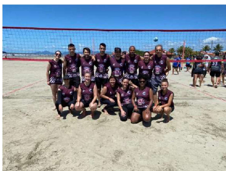
1º COLOCADO: CFP 6.03 – ARARAQUARA