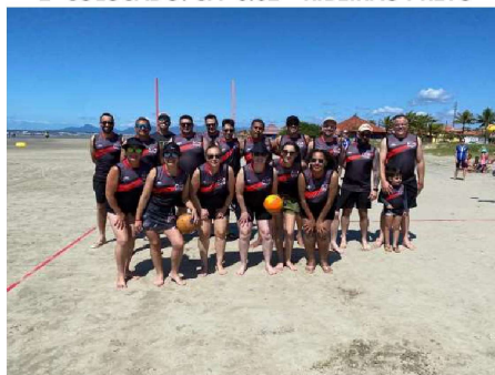
4º COLOCADO: CFP 7.92 – LENÇÓIS PAULISTA