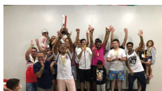
Campeão Futsal Livre

Abaixo fotos relacionadas aos eventos citados acima