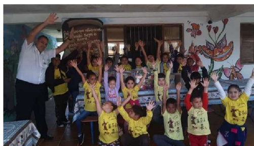
Entrega das cestas a Casa das Crianças Lar dos Franciscanos de Itanhaém