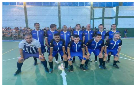
2º COLOCADO: CFP 6.02 – RIBEIRÃO PRETO