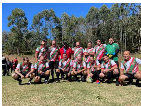
4º COLOCADO: CT 3.60 - Pindamonhangaba

ENTREGA DAS CESTAS PARA A COMUNIDADE DA CAPELA DE SÃO SEBASTIÃO NO BAIRRO DA ROSEIRA EM JUNDIAÍ