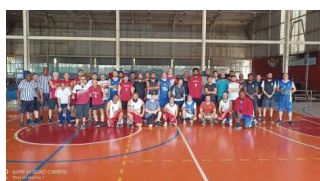
Festival de Basquete 3X3