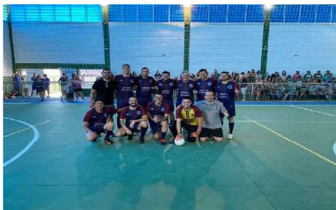
1º COLOCADO: CFP 7.01 – BAURU