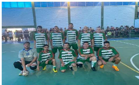
3º COLOCADO: CFP 4.02 / 4.04 - SOROCABA