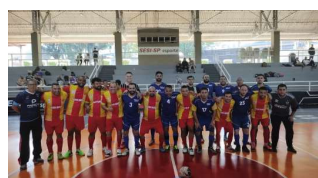
Regional 2022 - Futsal Livre