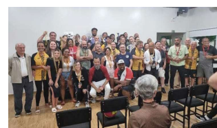
Final de Voleibol Misto