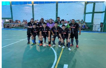
4º COLOCADO: CFP 5.63 / 5.92 – MOGI GUAÇU E SÃO JOÃO DA BOA BISTA