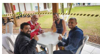
Finalistas Truco - FARAES