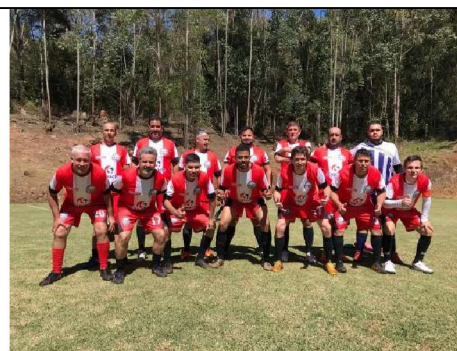
2º COLOCADO: CFP 6.02 – Ribeirão Preto