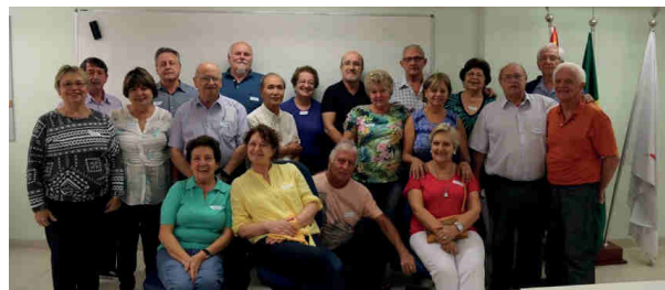
Reunião Aposentados - Maio 2018

O Grupo, após nosso habitual café, passou por atividade de integração e reflexão sobre o conteúdo a ser discutido durante nossos próximos encontros, incluindo programações apresentadas pelos participantes de forma integrada e com a coordenação do Departamento. Aproveitamos também para homenagear as mães com leitura de texto específico e entrega de brinde aos participantes.