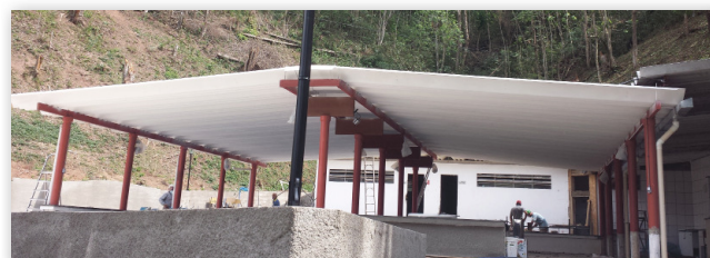
Recanto dos Manacás (Antigo Galpão)

Clube de Campo: No dia 16 de outubro será entregue, para uso dos associados, o "Recanto dos Manacás" (antigo galpão). Este espaço foi todo remodelado (churrasqueiras, sanitários e vestiários).